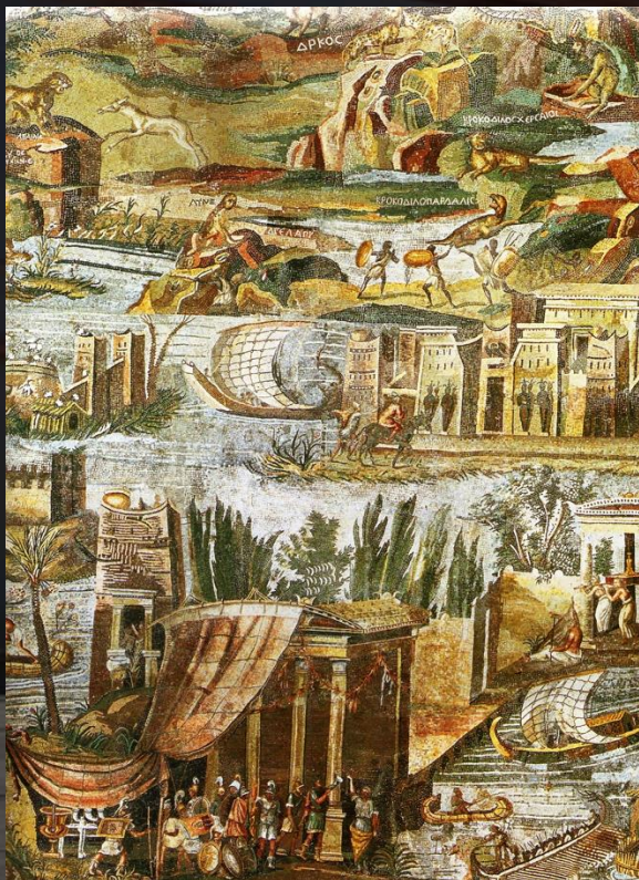
Détail de la mosaïque du Nil de Palestrina (actuelle Préneste). 2ème siècle av JC