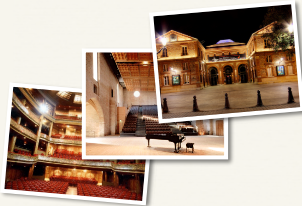
La Halle aux Grains, l'auditorium Saint-Pierre-des-cuisines et le Théâtre du Capitole de Toulouse, qui comptent parmi les plus prestigieuses salles musicales de France, accueillent régulièrement les étudiants de l'option musique.

La ville de Toulouse offre la possibilité aux étudiants d'assister à de nombreuses manifestations dans le cadre de leur enseignement :